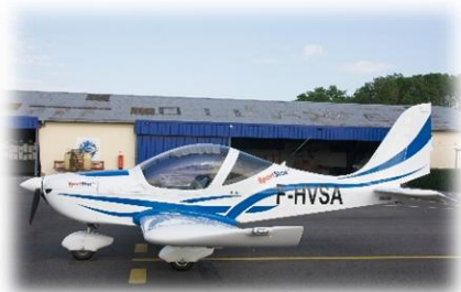
EVEKTOR SPORTSTAR (2 appareils)